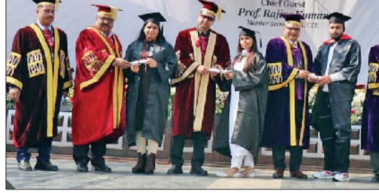
पानीपत। पाइंट में विद्यार्थियों को डिग्री बाँटते हुए अधिकारीगण।