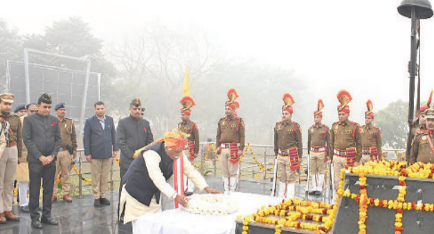
पानीपत में शहीद स्मारक पर पुष्पांजलि करते हुए राज्यपाल बंडारू दत्तात्रेय।

शहीदों को श्रद्धांजलि दी। गणतंत्र दिवस के अवसर पर राज्य स्तरीय समारोह में मुख्य अतिथि के रूप में पहुंचे प्रदेश के राज्यपाल बंडारू दत्तात्रेय ने जिला सचिवालय में स्थापित शहीद स्मारक पर पुष्प अर्पित कर शहीदों को श्रद्धांजलि दी। उन्होंने कहा कि शहीदों की बदौलत ही आज हम सुरक्षात्मक माहौल में अपना जीवन-यापन कर रहे हैं। हम सब सदैव इनके ऋणी रहेंगे।