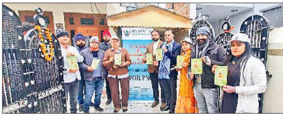
अंबाला। पीएनजी गैस कनेक्शन के लिए सेक्टर 9 के लोगों को जागरूक करते कंपनी अधिकारी।

पेट्रोलियम नेचुरल गैस रेगुलेटरी बोर्ड की ओर से गणतंत्र दिवस के मौके पर पूरे भारत में पाइप नेचुरल गैस अभियान की शुरुआत की गई। इसी कड़ी में हिंदुस्तान पेट्रोलियम ऑयल गैस कंपनी द्वारा सेक्टर-9 में दो घरों में पाइप नेचुरल गैस कनेक्शन लगाने का काम किया गया। इसके साथ-साथ प्रचार के माध्यम से पूरे सेक्टर में पाइप नेचुरल