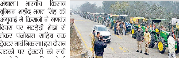
अंबाला। मटहंडी शेखां गांव के पास सड़क पर लाइन में खड़े ट्रैक्टरों का दृश्य।

अंबाला। भारतीय किसान यूनियन शहीद भगत सिंह की अगुवाई में किसानों ने गणतंत्र दिवस पर मटहंडी शेखां से लेकर पंजोखरा साहिब तक ट्रैक्टर मार्च निकाला। इस दौरान सड़कों पर ट्रैक्टरों की लंबी लाइनें देखकर पुलिस को भी परेशानी आ गयी। आनन फानन में ट्रैक्टर मार्च को लेकर पुलिस की ओर से सुरक्षा के लिए जल्द्री बंदोबस्त किए गए। मटहंडी शेखां से शुरू हुआ ट्रैक्टर मार्च पंजोखरा साहिब पहुंचा। यहां किसानों ने पंजोखरा साहिब गुरुद्वारा में मत्था टेककर अपने लिए दिल्ली कूच की उरअदास की। किसानों ने 13 फरवरी को दिल्ली कूच का ऐलान किया। भारतीय किसान यूनियन शहीद भगत सिंह के आह्वान पर सुबह से ही किसान मटहंडी शेखां में एकजुट हुए थे। यहां से ट्रैक्टर मार्च निकलते हुए लखनौर साहिब के लिए रवाना हुए। किसानों ने ट्रैक्टर लेटर मार्च में शामिल हुए। लखनौर साहिब से आगे मिर्जापुर होते हुए शाहपुर-मटहंडी पहुंचे। शहीद भगत सिंह किसान यूनियन के अध्यक्ष ने कहा कि दिल्ली कूच के दौरान सरकार के सामने फसलों पर एमएसपी गारंटी कानून बनाने, किसानों को कर्जा मुक्ति करने, लखीमपुर खीरी के किसानों को इन्साफ, अहिंसक तरीके से किसानों को 4 गुना रेट देना व बिजली बिलों को रद्द करने मांग रखी जाएगी। उन्होंने कहा कि किसान आंदोलन के दौरान केंद्र सरकार ने फसलों पर एमएसपी गारंटी कानून बनाने की बात कही थी। मगर अब तक सरकार ने अपने उस वादे को पूरा नहीं किया है। किसानों ने ऐलान किया कि अगर सरकार ने उनकी मांगों पर विचार नहीं किया तो फिर दूसरा किसान आंदोलन होगा। सभी किसान दिल्ली में ही डेरा डाल लेंगे।