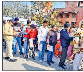
अंबाला। गृहमंत्री के आवास पर लगी लोगों की लाइनें।

दुराचार पीड़िता की शिकायत पर संज्ञान लेते हुए गृहमंत्री अनिल विज ने गोहाना डीएसपी को फटकार लगाई है। दुराचार के अन्य मामले में भिवानी के एसपी को भी मामले में सख्त कार्रवाई के निर्देश दिए गए हैं। विज शनिवार को अपने आवास पर लोगों की फरियादें सुन रहे थे। गोहाना से आई दुराचार पीड़िता ने बताया कि मामले में पुलिस ने अभी