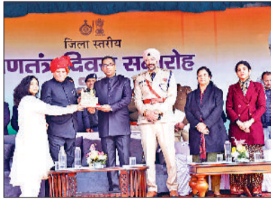
अंबाला। जिला स्तरीय गणतंत्र दिवस समारोह में शिक्षा मंत्री को सम्मानित करते अधिकारी, परेड़ की सलामी लेते हुए व कार्यक्रम में रंगारंग प्रस्तुति देते स्कूली छात्र।