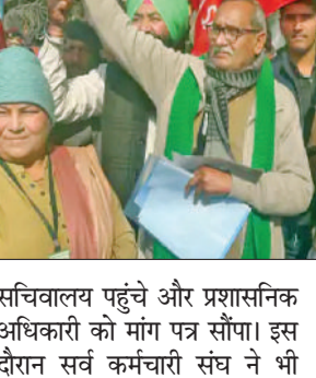
सचिवालय पहुंचे और प्रशासनिक अधिकारी को मांग पत्र सौंपा। इस दौरान सर्व कर्मचारी संघ ने भी

बल भी मौके पर मौजूद रहा है। ट्रैक्टर परेड में शामिल किसानों ने