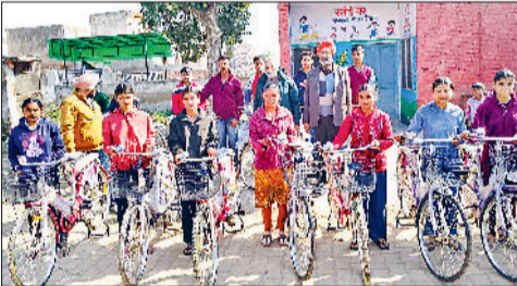
अंबाला। कुर्बानपुर में छात्रों को साइकिल वितरित करते हुए पूर्व मंत्री विनोद शर्मा।

पूर्व केंद्रीय मंत्री विनोद शर्मा ने शनिवार कई गांवों का दौरा कर बच्चों को साइकिलें वितरित की। इस दौरान विनोद शर्मा ने गांव भड़ी, अहमा, कुर्बानपुर, सैनी माजरा, इस्माइलपुर और सुल्लर जाकर स्कूली बच्चों को साइकिलें देकर उन्हें पुरजोर तरीके से शिक्षा हासिल करने के लिए प्रेरित किया। शर्मा ने कहा कि हर अभिभावक की इच्छा होती है कि उसका बच्चा पढ़ लिखकर नौकरी लगे। सरकार की स्कूल में पढ़ने वाले बच्चों को एक गांव से दूसरे गांव में पढ़ाई के लिए जाने में बहुत समय लग जाता था जिसको देखते हुए यह फैसला लिया गया कि बच्चों को साइकिल वितरित