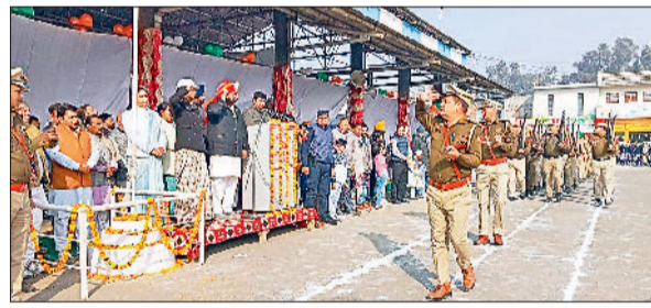
नारायणगढ़। परेड़ की सलामी लेते राज्यसभा सांसद कार्तिकेय शर्मा व अन्य।